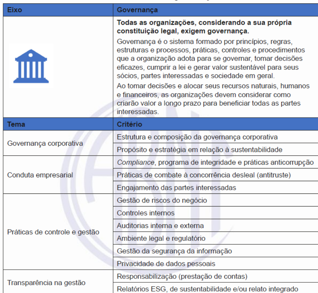
Tabela 3 – Eixo de governança